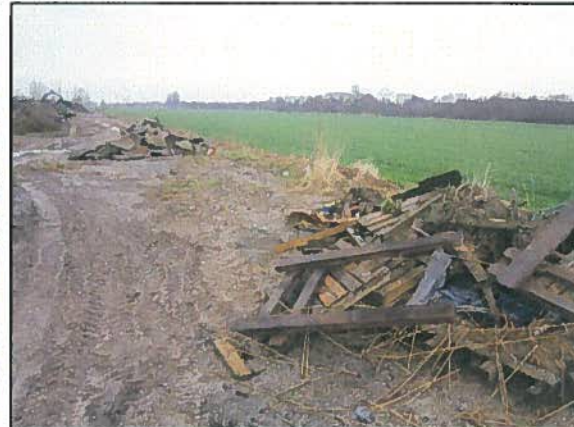
Afb. 8. Potentieel winterverblijf rugstreeppad.

Ten oosten van het terrein bevindt zich intensief beheerd grasland met enkele kleine sloten die de perceelsgrenzen vormen (zie afbeelding 9). Deze sloten zien er op het eerste gezicht minder geschikt uit (veel zwarte slijp, vermoedelijk veel invloed van landbouw, beperkte ruimte voor rijke oevervegetatie) dan de aanwezige hoofdwatgangen. Aanwezigheid van soorten als kleine modderkruiper en grote modderkruiper is echter niet volledig uit te sluiten. Deze soorten kunnen juist ook voorkomen op locaties waar andere vissoorten niet voorkomen. De sloten vormen onderdeel van een groter netwerk van watgangen en de genoemde soorten komen voor in het nabij gelegen natuurgebied 'Langstraat'.