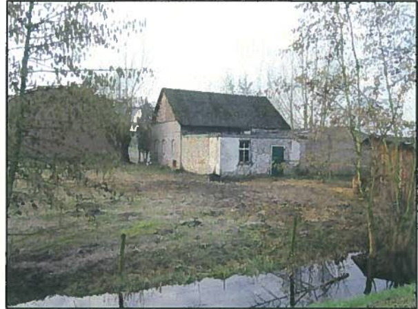
Afb. 3. Naastgelegen boerderij.