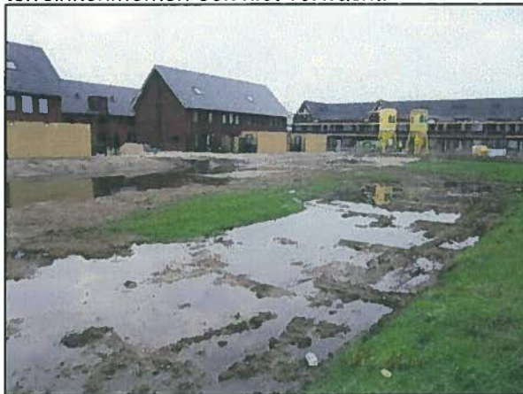
Afb. 4. Impressie van locatie 3.

Dit betreft twee locaties die bestaan uit een weinig bijzondere grasvegetatie. Onder andere smalle weegbree, jacobskruiskruid en duizendblad komen veelvuldig voor. Beschermde soorten zijn niet waargenomen en worden op basis van de terreinkenmerken ook niet verwacht.