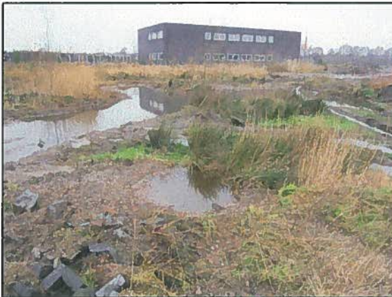
Afb. 7. Impressie van locatie 6.

Op deze locatie is een gronddepot aanwezig en wordt gewerkt met machines. Ook hier is oppervlaktewater blijven staan, waarschijnlijk vanwege de regenval. Het is een gevarieerd terrein waar vergraafbaar zand aanwezig is en veel bouwafval ligt. Hiermee vormt het in potentie geschikt leefgebied voor de streng beschermde rugstreeppad.