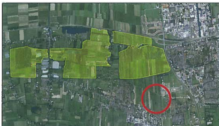
Figuur 3. Ligging plangebied (rode cirkel) ten opzichte van natuurgebied 'Langstraat'.

Het plangebied bevindt zich op circa 1 kilometer afstand van het beschermde natuurgebied 'Langstraat' (zie figuur 3). Het gebied is aangewezen vanuit de Europese Habitatrictlijn. Habitattypen en soorten die hier voorkomen zijn: 'kranswierwateren', 'blauwgraslanden', 'trilvenen', 'veenmosrietlanden', 'kalkmoerassen', 'grote modderkruiper' en 'kleine modderkruiper'.