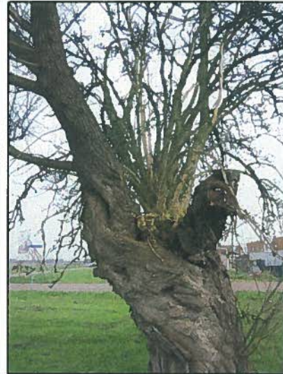
Afb. 7. Detailfoto wilg.