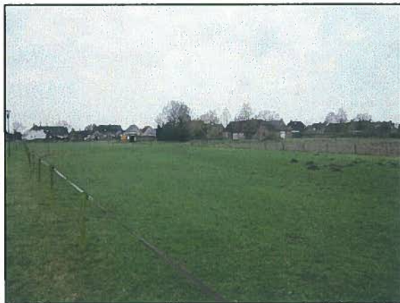
Afb. 12. Grens locatie 7 met bebouwing.