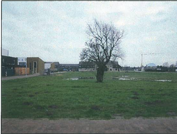
Afb. 6. Wilg met rustplaats steenuil.