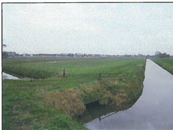
Afb. 11. Impressie van locatie 7.

Deze grote locatie bevindt zich aan de westzijde van het plangebied. Het terrein bestaat uit akkerland en weiland waar paarden worden gehouden en wordt begrensd door watergangen (o.a. de Sprangse sloot). Omdat het vrij intensief gebruikt (akker)land betreft, wordt aanwezigheid van beschermde soorten planten niet verwacht. Het terrein vormt, afhankelijk van de intensiteit van het gebruik, geschikt broedgebied voor weidevogels als kievit. Het zuidelijke deel dat grenst aan de lintbebouwing (boerenerven) maakt mogelijk deel uit van het leefgebied van de steenuil, welke op locatie 5 is waargenomen. Net als voor locatie 1 geldt hier dat niet uit te sluiten is dat beschermde vissoorten voorkomen in de aangrenzende watergangen.