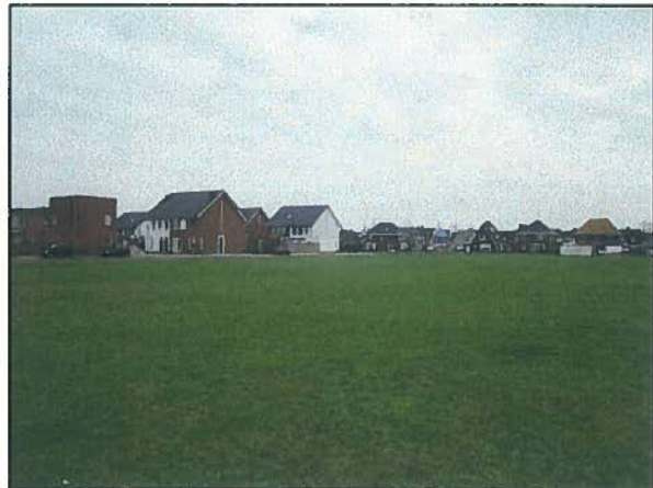
Afb. 5. Impressie van locatie 4.