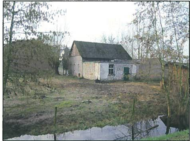
Afb. 3. Naastgelegen boerderij.