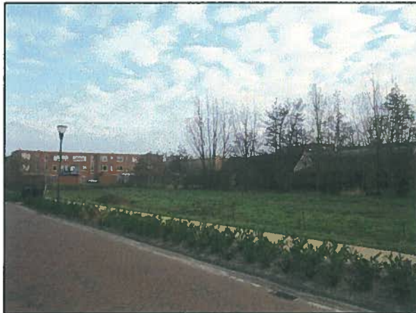
Afb. 2. Impressie van locatie 2.

voor steenuil. De bomen en struiken zorgen voor beschutting en onder andere de aanwezigheid van pony's zorgt voor aanbod van voedsel (insecten in de mest). Op het eerste gezicht zijn geen sporen van aanwezigheid of nestkasten van steenuil waargenomen. Het boerenerv is echter niet volledig geïnspecteerd.