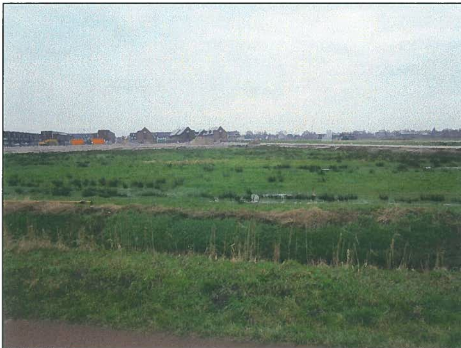
Afb. 1. Impressie van locatie 1.

In 2011 is in de watergang tussen het plangebied en de weg kleine modderkruiper aangetroffen. Tijdens het nu uitgevoerde veldbezoek zijn enkele stekelbaarsjes met een schepnet gevangen. Het is echter niet uit te sluiten dat kleine modderkruiper voorkomt in de aanwezige hoofdwatgangen.