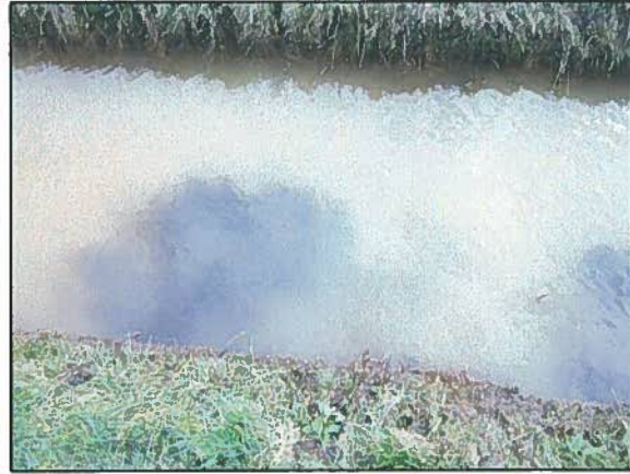
Afb. 10. Donkere slib in sloot.