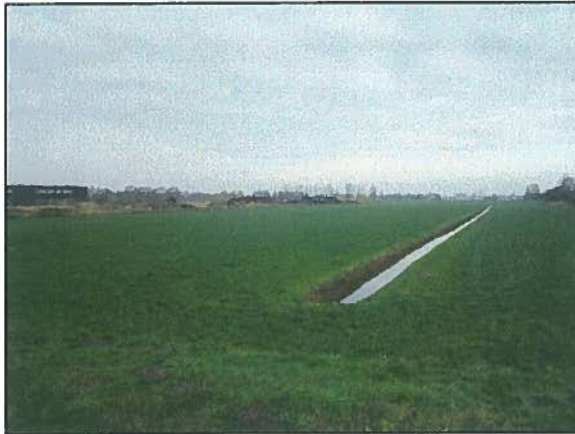
Afb. 9. Sloot oostkant locatie 6.