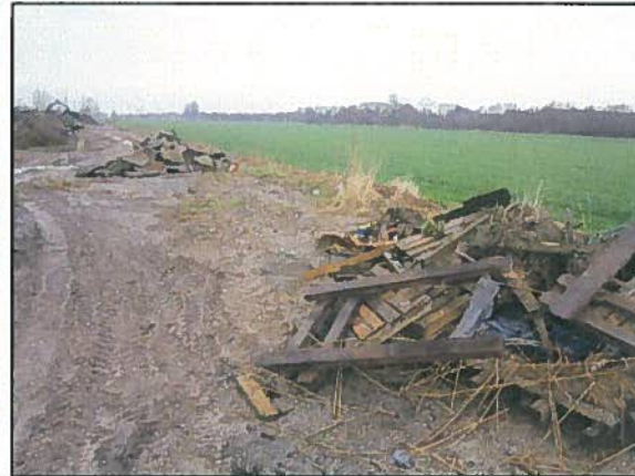
Afb. 8. Potentieel winterverblijf rugstreeppad.

Ten oosten van het terrein bevindt zich intensief beheerd grasland met enkele kleine sloten die de perceelsgrenzen vormen (zie afbeelding 9). Deze sloten zien er op het eerste gezicht minder geschikt uit (veel zwarte slijp, vermoedelijk veel invloed van landbouw, beperkte ruimte voor rijke oevervegetatie) dan de aanwezige hoofdwatgangen. Aanwezigheid van soorten als kleine modderkruiper en grote modderkruiper is echter niet volledig uit te sluiten. Deze soorten kunnen juist ook voorkomen op locaties waar andere vissoorten niet voorkomen. De sloten vormen onderdeel van een groter netwerk van watgangen en de genoemde soorten komen voor in het nabij gelegen natuurgebied 'Langstraat'.