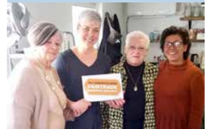
Nicole's Hair & Make-up

De werkgroep zet zich ook de komende tijd weer actief in om bedrijven en maatschappelijke organisaties fairtrade te certificeren. Wil jij hieraan mee doen of op een andere manier je steentje bijdragen? Of heb je vragen? Stuur dan een mail naar fairtradewaalwijk@outlook.com