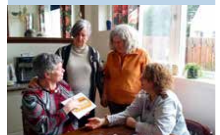
B&B Heerlijk Gemaakt