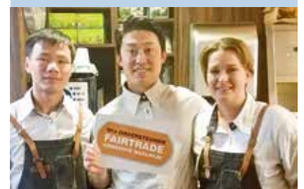
De vergulden Erpel