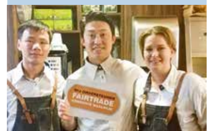
De vergulden Erpel