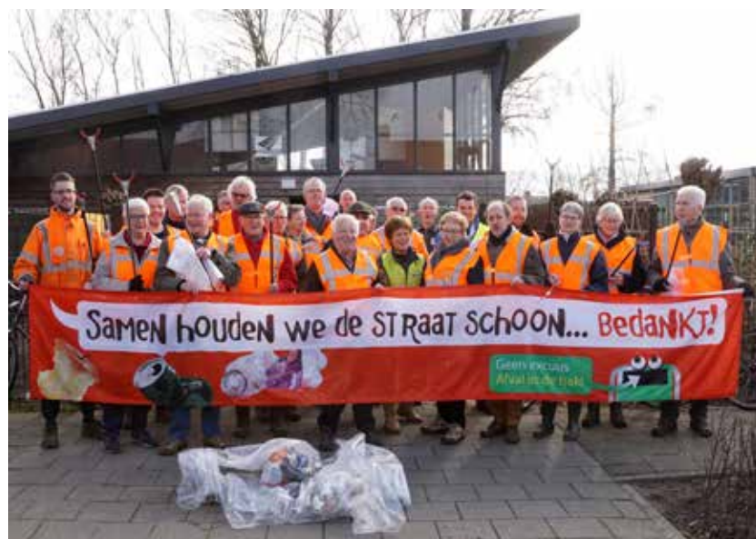
Wij bedanken iedereen die zich heeft ingezet om de leefomgeving schoon te houden!

De gemeente regelde de materialen, zorgde voor een versnapering en voerde het afval dezelfde middag nog af. Een prima samenwerking tussen inwonersgroepen en gemeente.