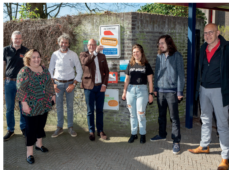
Scholengemeenschap De Overlaat