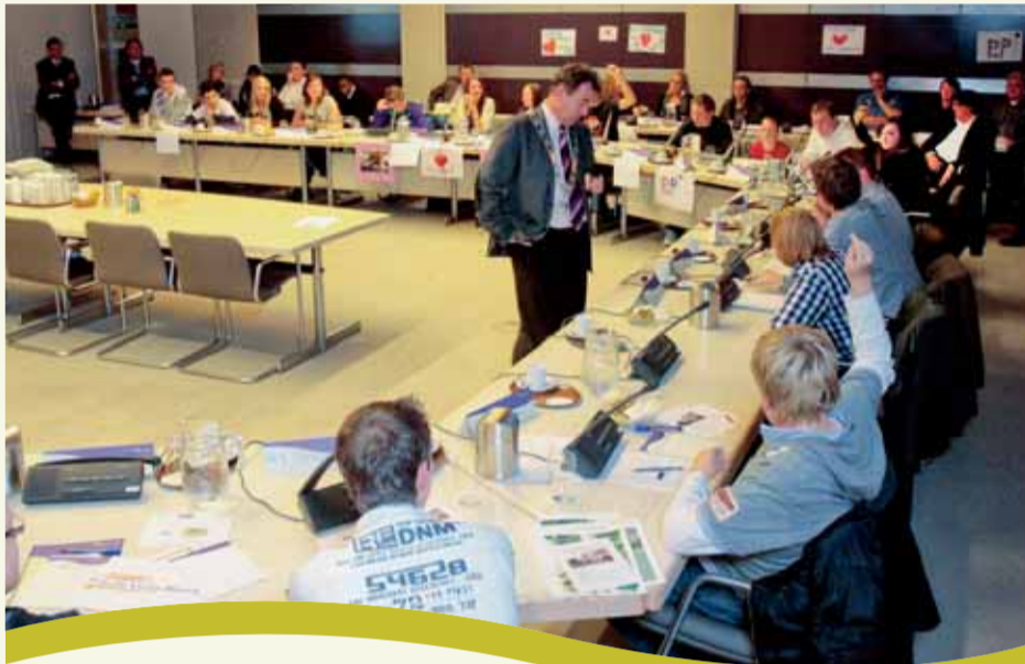
jongeren tijdens het debat in de raadzaal