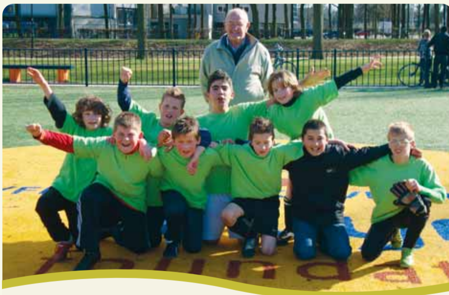
Het winnende jongens team van Basisschool Pieter Wijten

De winnende teams mogen op woensdag 14 april in Nijmegen deelnemen aan het regionale toernooi dat door de Johan Cruyff Foundation georganiseerd wordt. De gemeente Waalwijk wenst de teams veel succes!